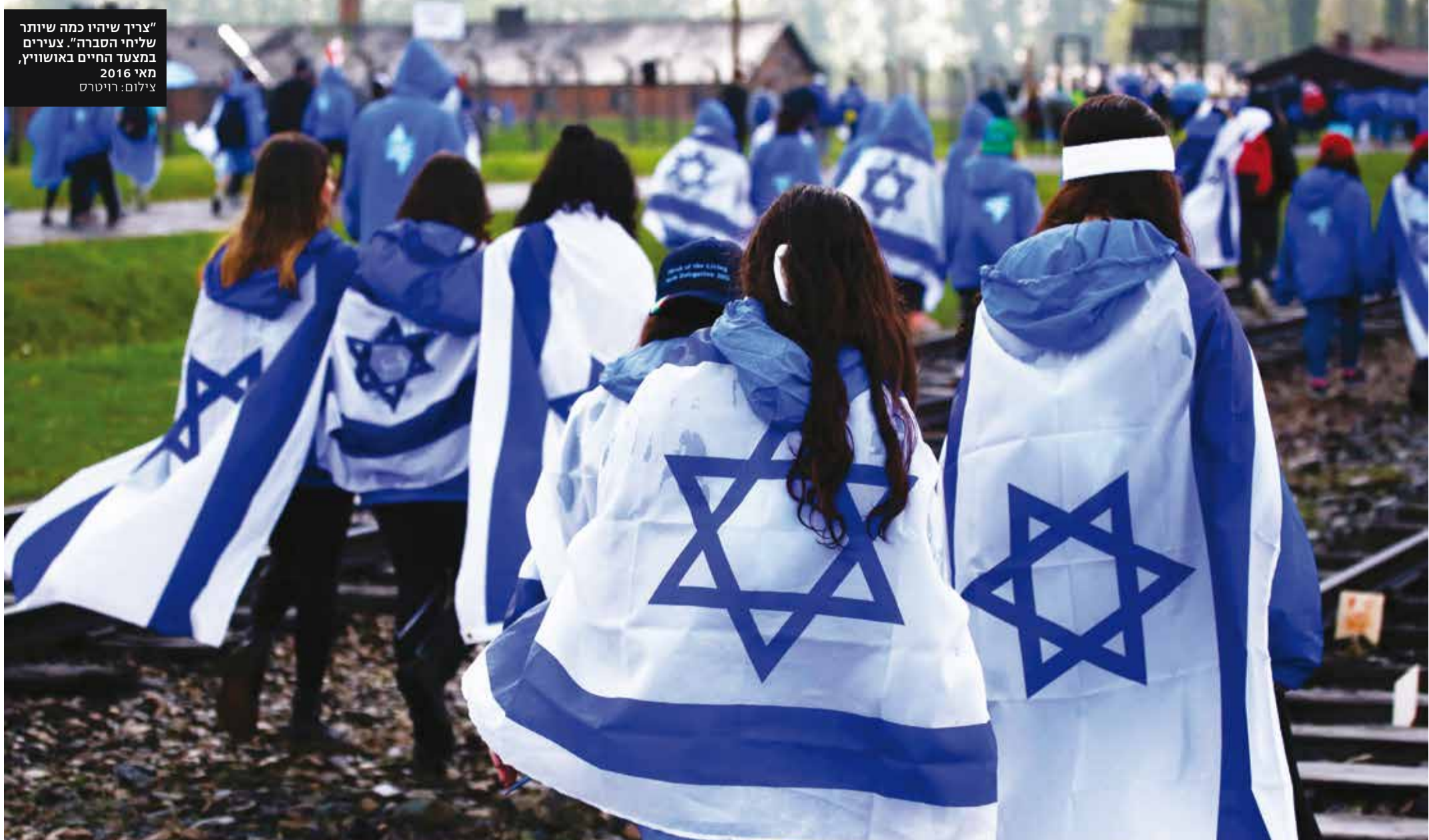
"צריך שיהיו כמה שיותר שליחי הסברה", אנונימי במצעד החיים באושוויץ, מאי 2016